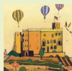
Illustrationen: Gerhard Hofmann

HAMBACH repräsentiert die Idee einer Demokratie von unten, die europäisch, weltoffen und solidarisch ist. Dieses Anliegen tragen wir mit den Demokratietagen #2021 HAMBACH 1832, einer bunten Palette von Veranstaltungen, in die Rhein-Neckar-Region.